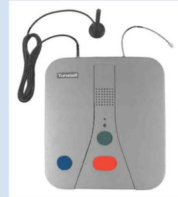
Hausnotruf- bzw. Sonderrufanlage